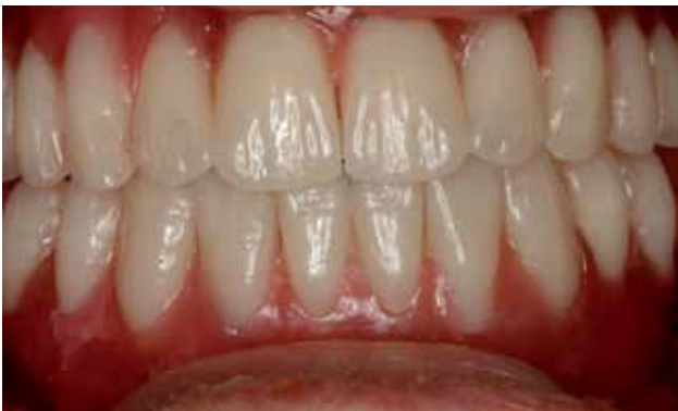
FIGURA 5 Y 6 Encerado diagnóstico probado sobre la paciente para la confección de la prótesis de carga inmediata.