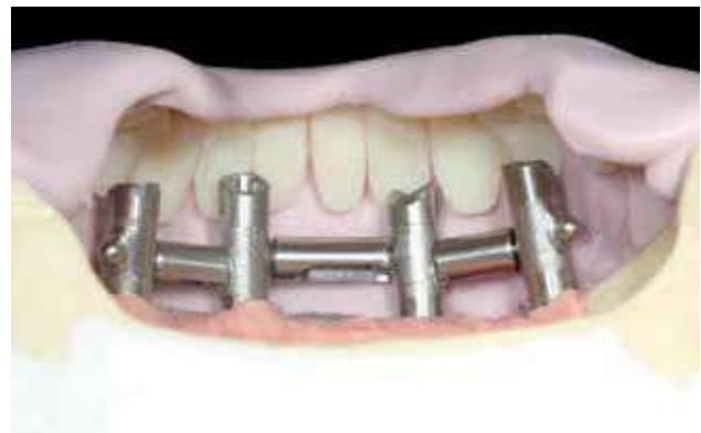
FIGURA 8 - 11

Colocación del frente dental con la llave de silicona para comprobar la viabilidad de la estructura confeccionada.