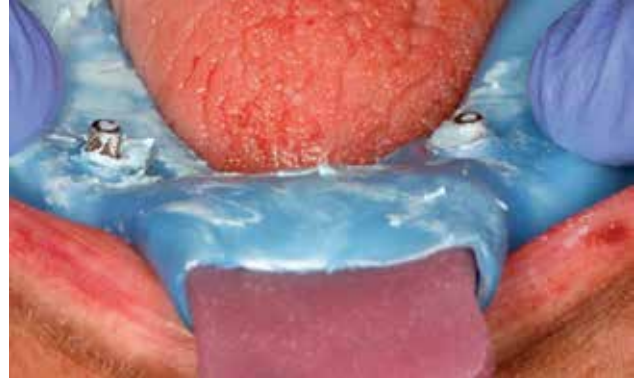
FIGURA 2 Inserción de la cubeta abierta para la impresión.