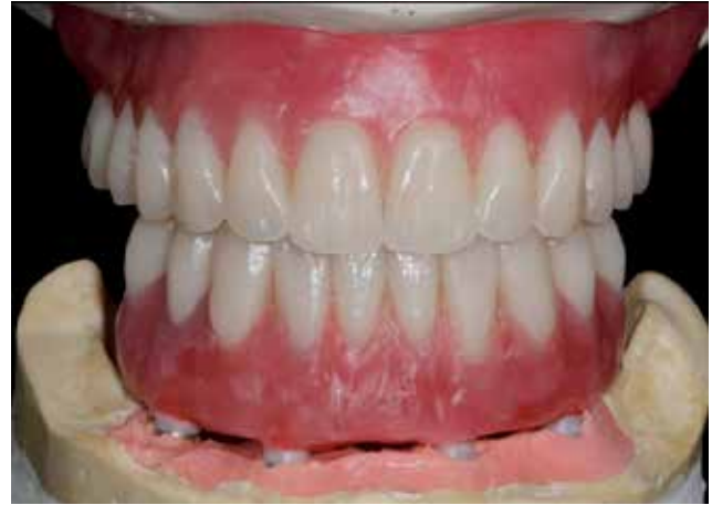
FIGURA 14 Y 15 Encerado sobre la estructura para la confección de la prótesis.

Finalmente realizamos un encerado sobre la estructura manteniendo la posición de los dientes que hemos obtenido del frente de silicona (figuras 14 y 15). Finalmente, confeccionamos la prótesis (figuras 16 a 21).