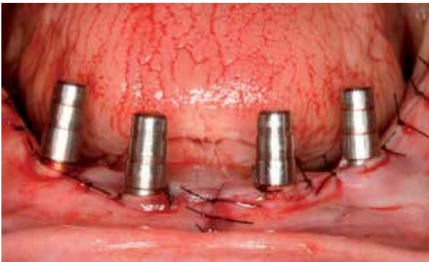
FIGURA 3 Colocación sobre los transepiteliales de los indicadores de registro oclusal para la toma de la dimensión vertical y la relación maxilo-mandibular.