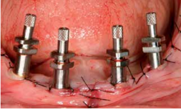
FIGURA 1 Toma de impresión con los copings sobre los transepiteliales para evitar retirarlos. Esta técnica minimiza las tensiones sobre los implantes y conserva el hermetismo implante transepitelial.